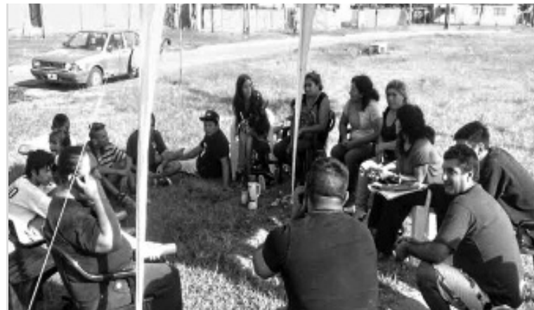
Punto de encuentro comunitario en la plaza pública de Casasco.