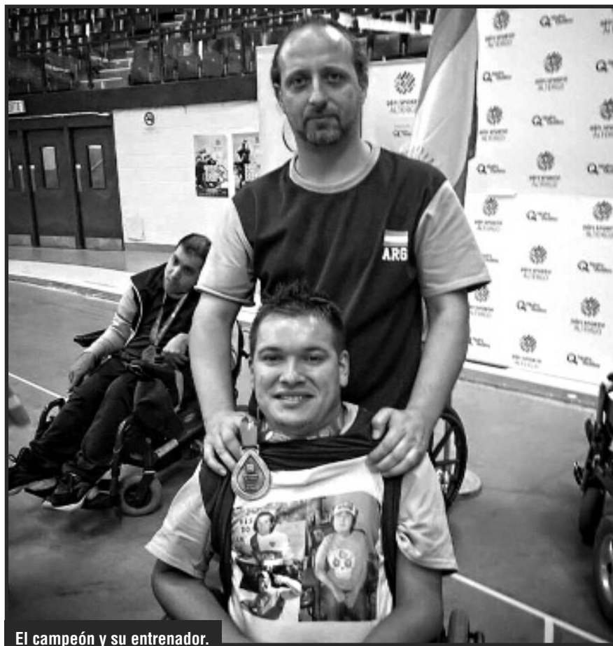
El campeón y su entrenador.