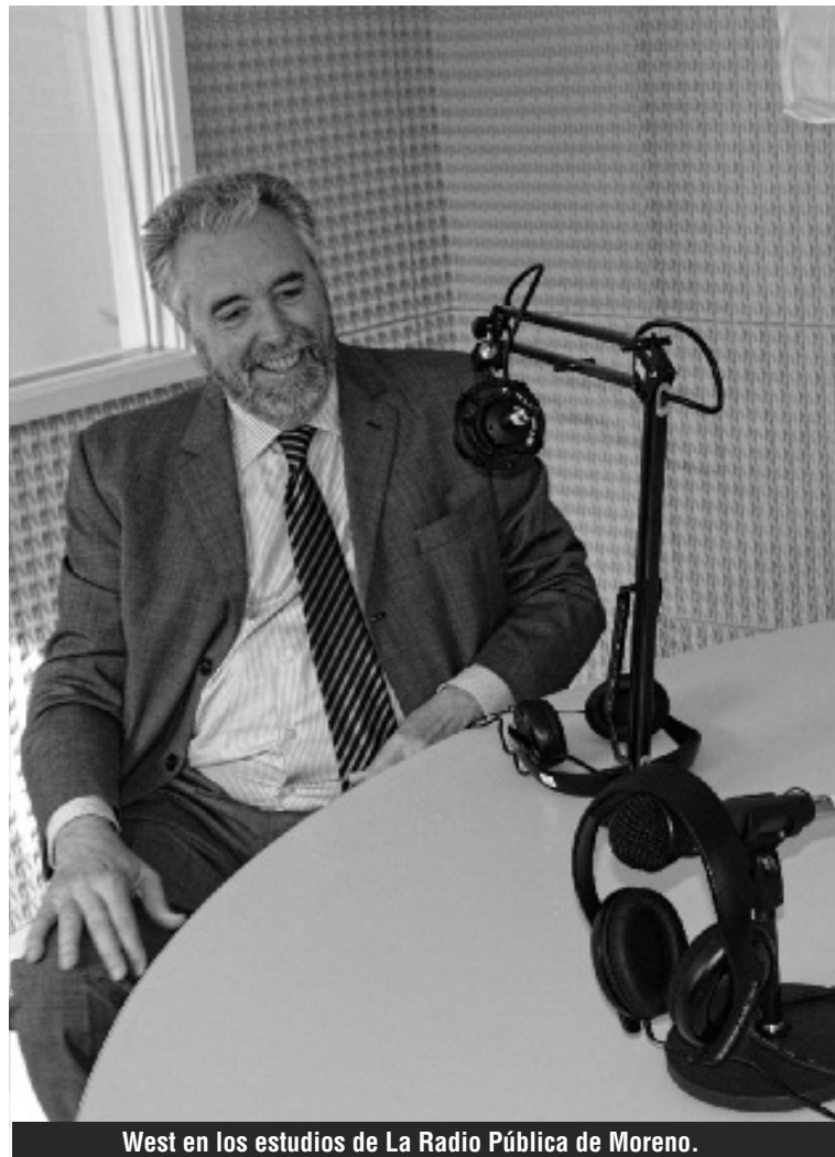
West en los estudios de La Radio Pública de Moreno.

El titular del Ejecutivo enumeró las acciones que desarrolla desde su gestión: “En el Municipio hemos iniciado un camino apasionante de nuevas formas de administración, con la creación de fideicomisos que