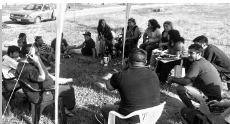
ABORDAJE PREVENTIVO BARRIAL ENTRE EL MUNICIPIO Y LA SEDRONAR