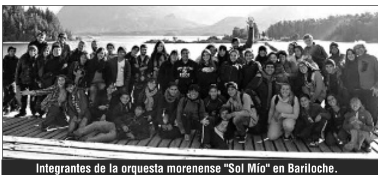
Integrantes de la orquesta morenense "Sol Mío" en Bariloche.