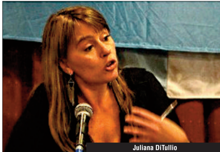
Juliana Di Tullio

Juliana Di Tullio nació en Morón el 22 de octubre de 1971. Estudió psicología social y militó en el peronismo desde la escuela secundaria. Entre 2003 y 2005 fue embajadora para temas de la mujer de la Cancillería. En 2005 fue electa por primera vez diputada nacional y en 2013 se convirtió en jefa del bloque mayoritario: el Frente para la Victoria. Su defensa de los derechos de la mujer in-