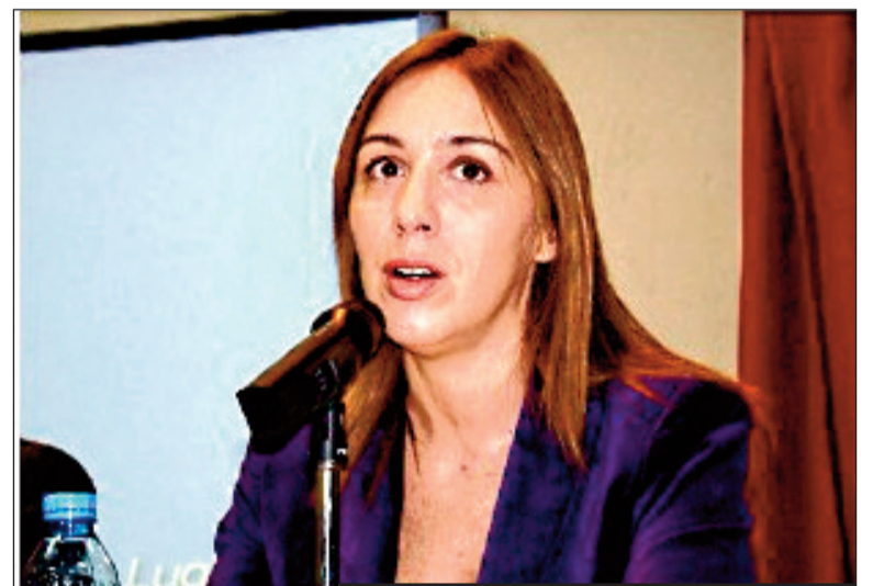
María Eugenia Vidal