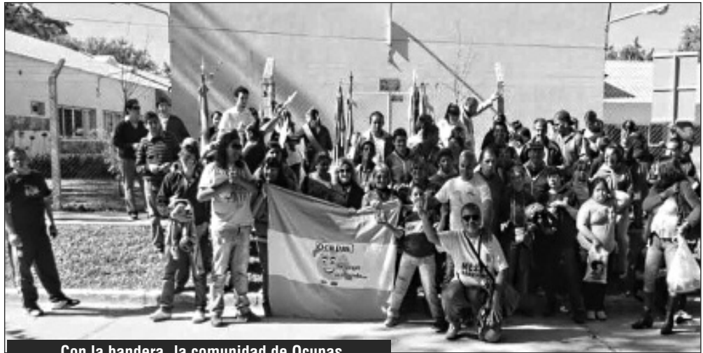
Con la bandera, la comunidad de Ocupas.

- Son 60 personas de las cuales, solo un 12 por ciento tienen una per-