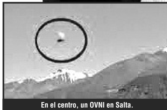
En el centro, un OVNI en Salta.

que se produce en Argentina una gran oleada OVNI donde los dos sitios más activos fueron el valle de Calamuchita en Córdoba y El Corredor del Oeste. Desde ese año, así defino a esa zona del Conurbano.