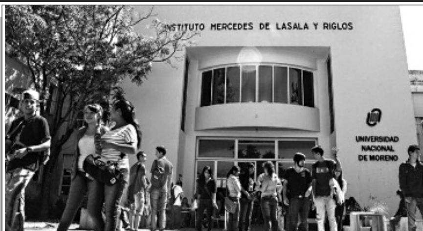
UNIVERSIDAD NACIONAL DE MORENO - PRIMERA PARTE